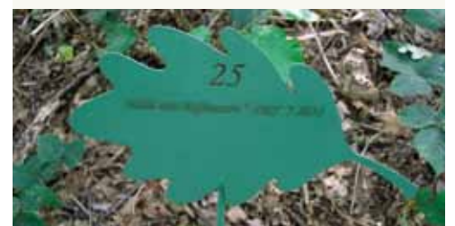
Ein grünes Eichenlaub-Schild mit den Angaben des Verstorbenen