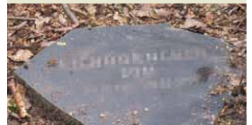
Steinplatte mit dem Namen des Verstorbenen (Geburts- und Sterbedaten können ebenfalls auf Wunsch eingetragen werden.)