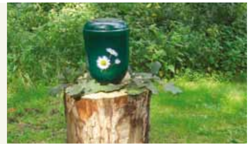
Beispiel einer biologisch-abbaubaren Urne

Unsere Beratung ist kostenlos, vertraulich und unverbindlich.